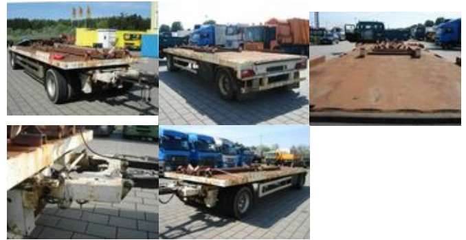
Renders Anh Containeranhänger Anhänger für Absatzcontainer

Preis (brutto): 3.451,00 € Gesetzl. MwSt. 19%: 551,00 €