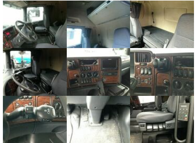
Scania R 420 4x2 R420 4x2 Lowliner, Twin Tec Rußfilterkat

Preis (brutto): 11.781,00 € Gesetzl. MwSt. 19%: 1.881,00 €