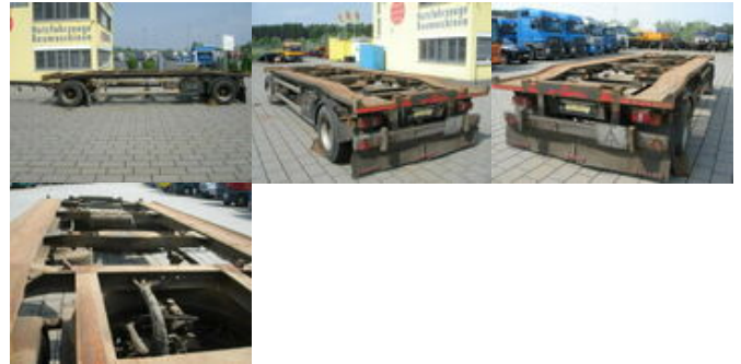
Hüffermann HAR 1870