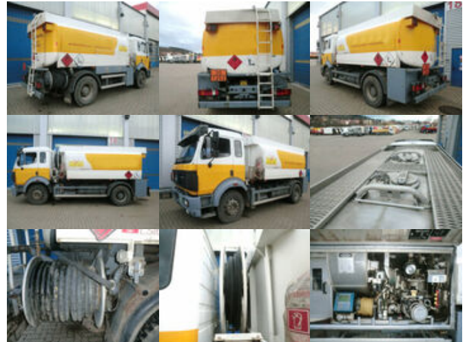
Mercedes-Benz SK 1824 L 4x2 SK 1824 L 4x2, Esterer Tankaufbau ca. 13.100l, 2 Kammern

Preis (brutto): 23.681,00 € Gesetzl. MwSt. 19%: 3.781,00 €