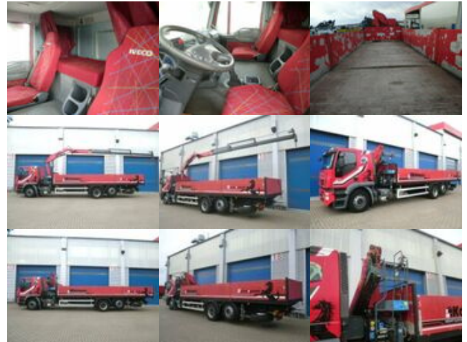
Iveco AT260S31Y/P 6x2 AT260S31Y/P 6x2 mit Kran Copma 150.3

Preis (brutto): 47.481,00 € Gesetzl. MwSt. 19%: 7.581,00 €